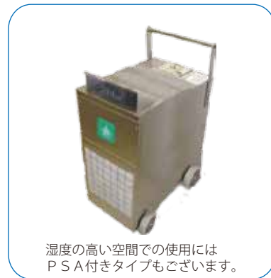
湿度の高い空間での使用には P S A 付きタイプもございます。